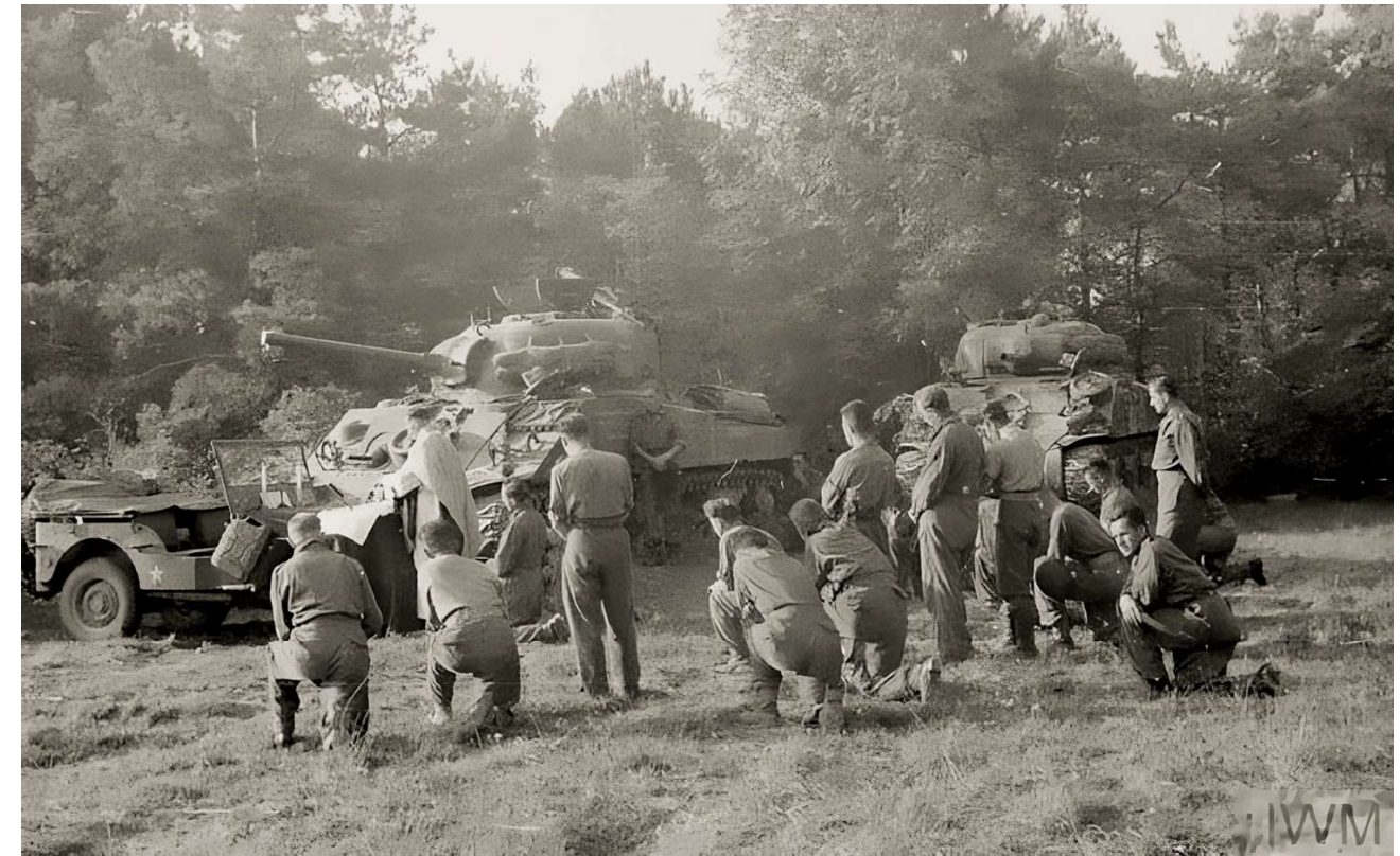
Soldaten van de 1e Poolse Pantserdivisie gaan voorafgaand aan de actie in Falaise in gebed.

Op de ochtend van 6 juni 1944 begon de invasie met massale luchtlandingen en bombardementen om de verdediging van de Duitse troepen te verzwakken. Vervolgens werden de geallieerde troepen aan land gezet op de vijf geselecteerde stranden. Het strand van Omaha werd geconfronteerd met bijzonder zware tegenstand van de Duitsers, wat resulteerde in aanzienlijke verliezen aan geallieerde zijde. Desondanks wisten de