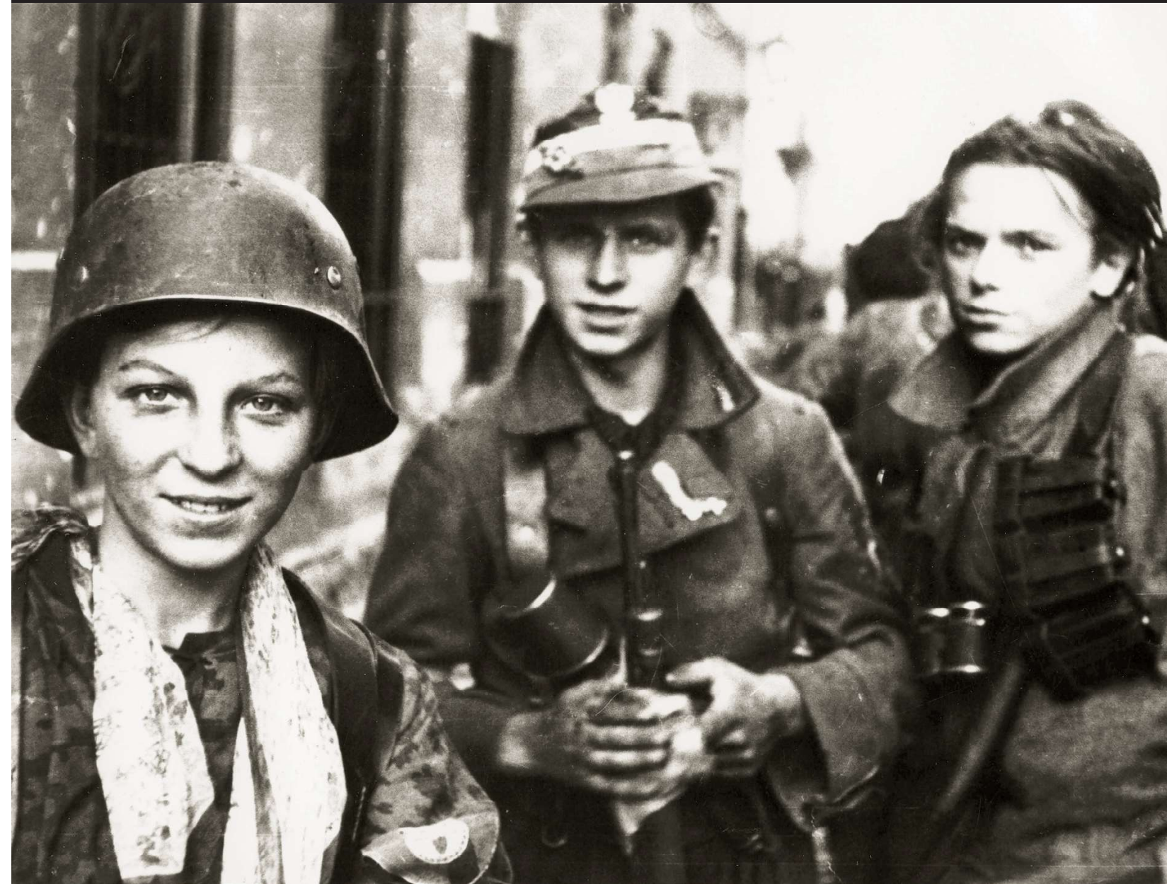
Rechts: Groep jonge soldaten op 2 september 1944.