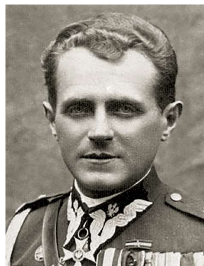
Generaal Michał Karaszewicz-Tokarzewski.