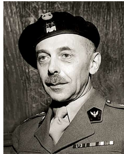
Generaal Tadeusz Komorowski.

Het doel van de Opstand van Warschau was de stad bevrijden van de Duitsers. De ontdekking van Poolse massagraven bij Katyn in april 1943 betekende een breuk in de Pools-Russische betrekkingen, die nooit volledig hersteld kon worden. Het plan was om in het hele land in opstand te komen. Ondanks twijfels over de militaire kansen van een grote opstand ging de planning door. Op 13 juli 1944 kwamen de plannen in een stroomversnelling, toen de Sovjets de vooroorlogse Poolse grens overschreden. Op dat moment moesten de Polen een beslissing nemen: een opstand beginnen in deze moeilijke politieke situatie met