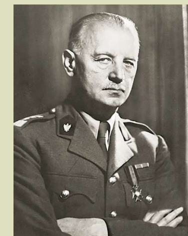
Generaal Władysław Sikorski.

Als premier van Polen in ballingschap zette Sikorski zich in voor het behoud van de Poolse strijdkrachten en de Poolse zaak in het buitenland. Hij onderhield nauwe banden met de geallieerden en pleitte herhaaldelijk voor een krachtiger steun aan Polen in de strijd tegen nazi-Duitsland. Sikorski's invloed werd steeds groter en hij speelde een cruciale rol in het vormgeven van de Poolse eenheden die onder het commando van de geallieerden vochten. Hij streefde ook naar gerechtigheid voor oorlogsmisdaden en pleitte voor onderzoek naar de