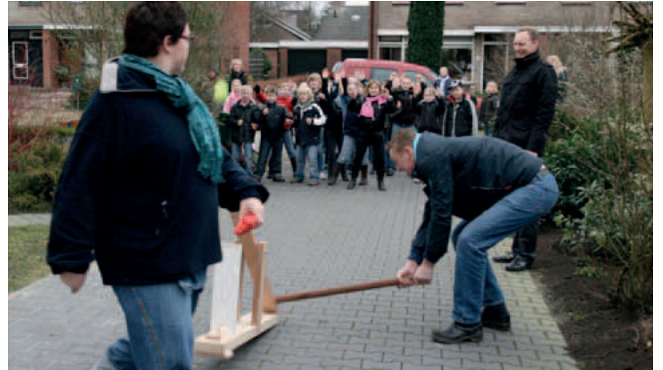
Bij de lagere school OBS De Woert in Oosterhesselen is het Sint-Pieterbalslaan nog steeds een traditie.

gaf daarmee aan dat hij in het eerstkomende jaar in het huwelijk zou treden. Weigerde een vrijgezel om de bal uit te slaan, dan werd hij Harm Doest of Doestcobbe genoemd, een naam die hij vaak tot zijn dood behield.